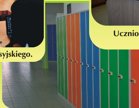
U nas w szkole.