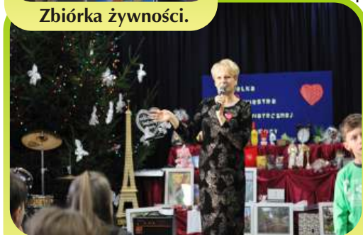
22 finał WOŚP.

Nasi uczniowie uczą się empatii i wrażliwości. Od kilku lat otwieramy nasze serca pomagając potrzebującym. Organizujemy wiele akcji charytatywnych: sztab WOŚP, zbiórki żywności we współpracy z Federacją Banków Żywności, działamy dla TPD.