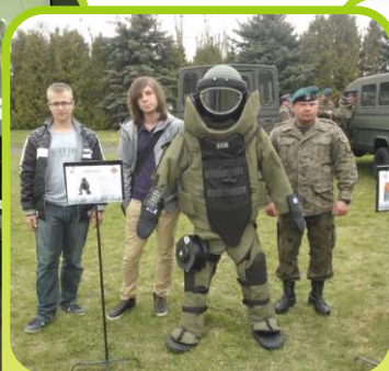
Chłopcy z kl IB LO w czasie prezentacji sprzętu w JW w Przasnyszu /kwiecień 2013/.