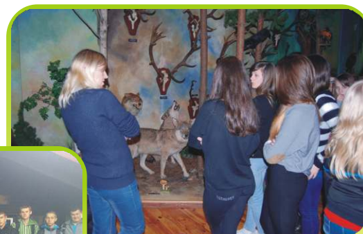
Wykład w Muzeum Łowiectwa i Jeździectwa w Warszawie.