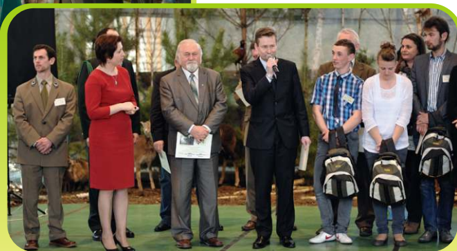
Gratulacje dla zwycięzców od Wójta Gminy Nowe Miasto /kwiecień 2013/.