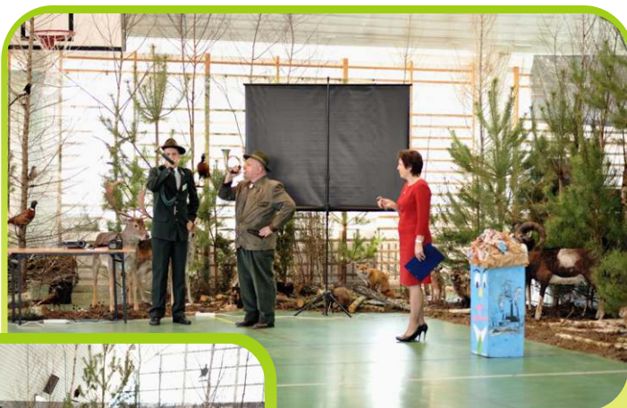
Myśliwskie powitanie gości – IV Edycja EKO-ŁOW.