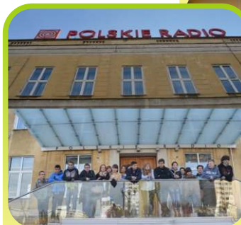
Przed okazałym gmachem „Polskiego Radia”

Rozwijamy zainteresowania kulturalne uczniów poprzez wyjazdy do teatrów na sztuki kostiumowe i nowoczesne, wizyty w muzeach, galeriach plastycznych, dyskusje na temat obejrzanych filmów albo najgłośniejszych wydarzeń kulturalnych. Proponujemy naszym uczniom udział w wielu projektach, konkursach, akcjach: maraton filmowy, konkursy literacko-publicystyczne, plastyczne, muzyczne, fotograficzne. To tylko niektóre ze sposobów, jakimi posługują się nauczyciele, aby kształtować zainteresowania i ciekawość kulturową uczniów.