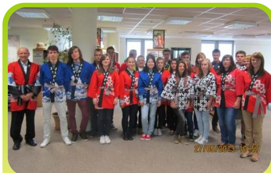
Nasza ostatnia majowa wizyta w Ambasadzie Japonii.