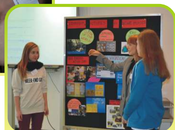
Spotkanie szkół partnerskich Schillerschule /luty 2014/.