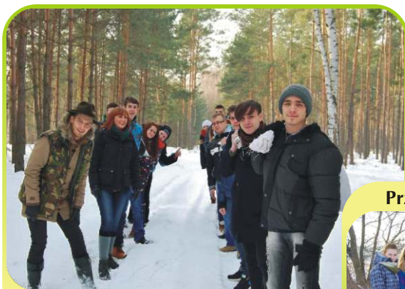
Dokarmiamy zwierzęta zimą w ramach programu „Ożywić pola”. Młodzież z klasy I i II B LO w drodze do paśnika /styczeń 2014/.