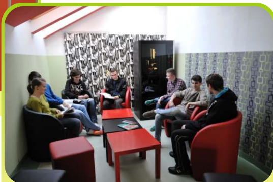
Chwila na relaks, szkolny korytarz.