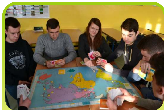
Gra symulacyjna, nasi uczniowie w roli dociekliwych inwestorów i konsumentów.

Mieliśmy okazję poznać historię Polskiego Radia, zwiedzić studia, w których są nagrywane audycje, uczestniczyć w warsztatach prowadzonych przez dziennikarza Polskiej Agencji Informacyjnej. Skorzystaliśmy też z możliwości poznania profesjonalnego sprzętu. Spotkanie z jedną z dziennikarek programu pierwszego zaowocowało wywiadami z naszymi uczniami, które zostały wyemitowane następnego dnia.