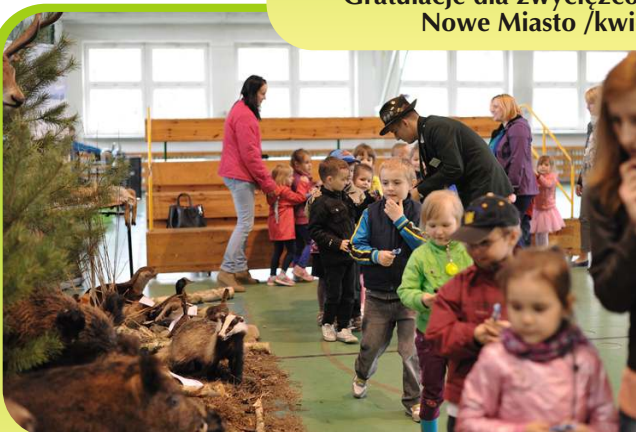
Przedшкоlaki zwiedzają wystawę łowiecką w Naszej Szkole /kwiecień 2013/.