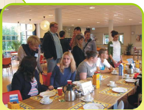
Przerwa na lunch w Mendelcollage.