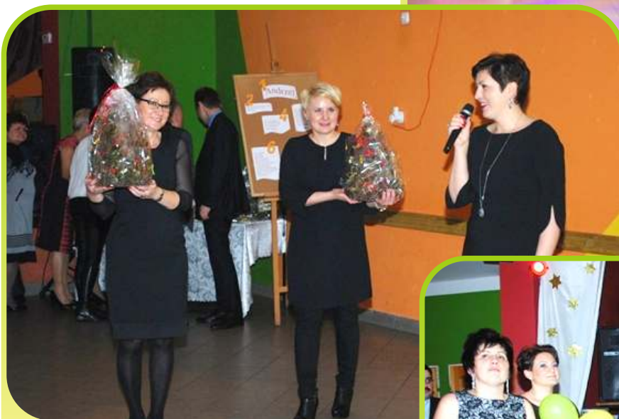
Zabawa Andrzejkowa. Licytacja prac artystycznych na rzecz szkoły.