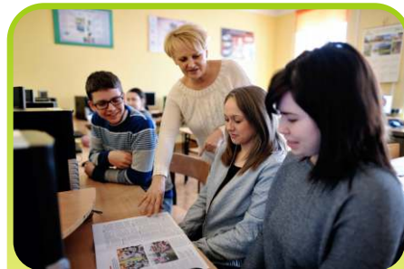
Na zajęciach analizujemy artykuł prasowy.