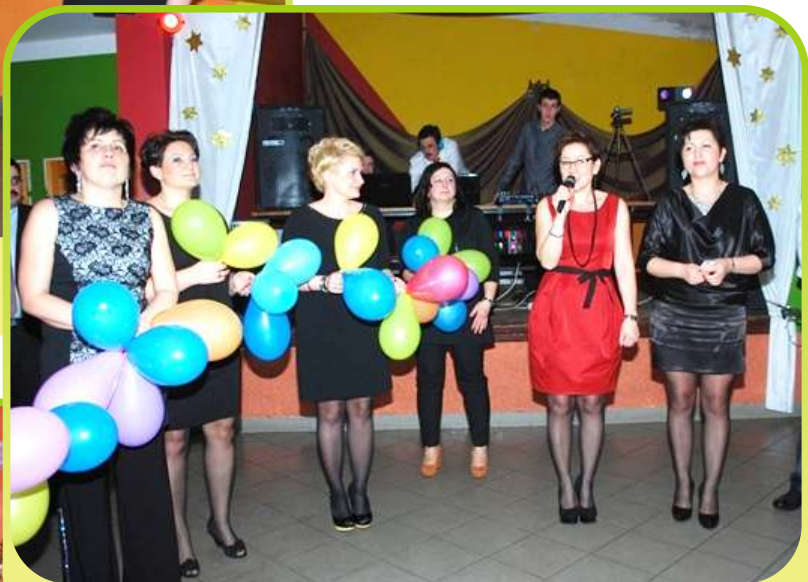
Sylwester 2013/14. Konkurs na najbardziej wystrzałową parę.