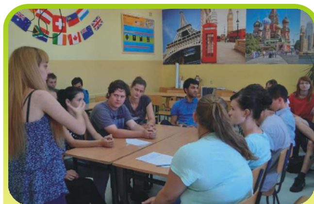
Debata Oksfordzka, Klasy I A LO i II LO.