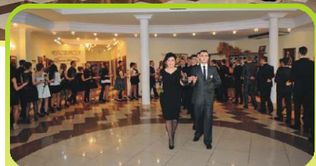
Poloneza czas zacząć, w pierwszej parze Pani Dyrektor i maturzysta.