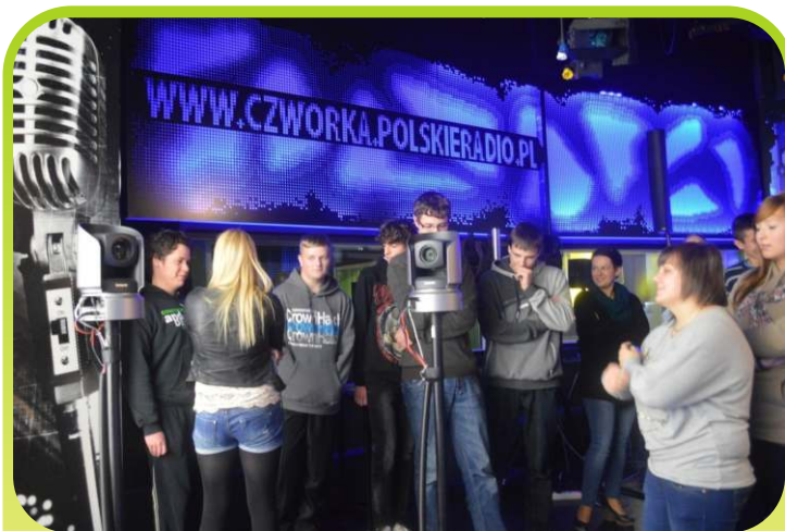
Grupa warsztatów dziennikarskich i Szkolnego Radiowęzła podczas wizyty w Polskim Radiu.

Mieliśmy okazję poznać historię Polskiego Radia, zwiedzić studia, w których są nagrywane audycje, uczestniczyć w warsztatach prowadzonych przez dziennikarza Polskiej Agencji Informacyjnej. Skorzystaliśmy też z możliwości poznania profesjonalnego sprzętu. Spotkanie z jedną z dziennikarek programu pierwszego zaowocowało wywiadami z naszymi uczniami, które zostały wyemitowane następnego dnia.