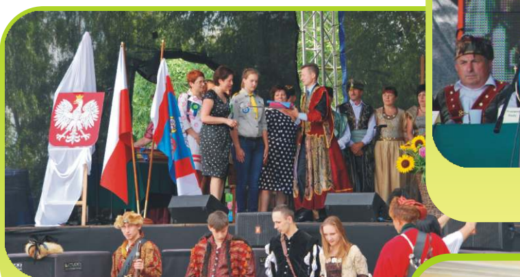
Przekazanie symboli Gminy Dyrektorowi ZS.