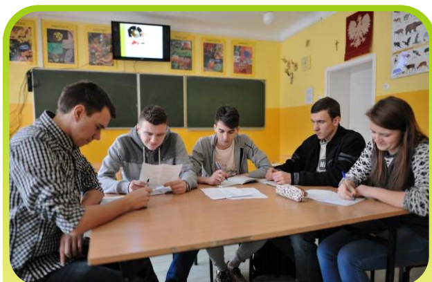
Podajmujemy biznesowe decyzje