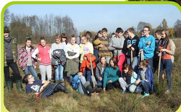
Grupa młodzieży po zakończeniu sadzenia remizy śródpolnej /październik 2013/.