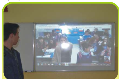
Videokonferencja – „na łączach” przyjaciele z Hiszpanii.