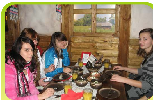
Smakowite bliny z łososiem restauracja «Бабушка».