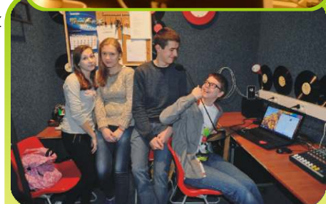
Prawie cała ekipa Szkolnego Radiowęzła czyli w szkolnym studio.