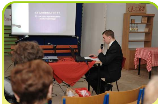
Prezentacja multimedialna pokazująca drogę kształtowania się polskiej demokracji – 13 grudnia 2011r.

10 stycznia 2014r. zaprosiliśmy Darczyńców - przyjaciół szkoły, władze gminy, banku, sponsorów oraz rodziców do naszej małej sali gimnastycznej, gdzie odbyła się licytacja na rzecz WOŚP.