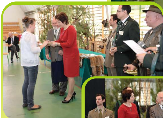
Wręczenie I nagrody w konkursie.