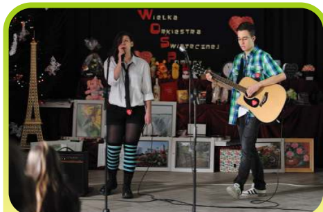
Szkolny zespół „Rebells' Time” podczas 22 Finału WOŚP w naszej szkole.