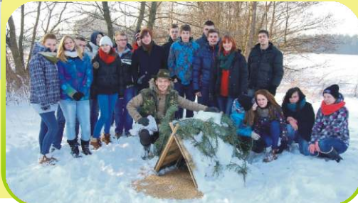
Przy budce w remizie śródpolnej.