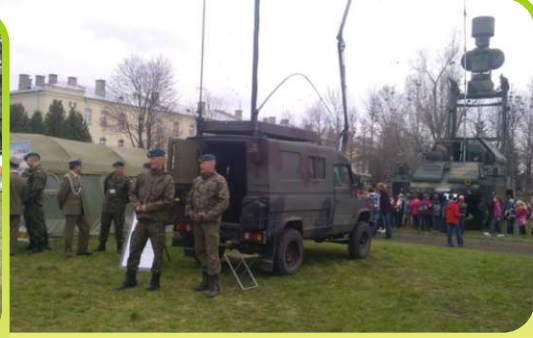
Pokazy sprzętu wojskowego - święto Jednostki w Przasnyszu /kwiecień 2013/.