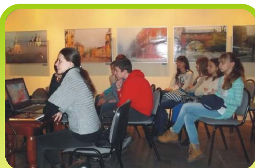
RONIK- projekcja filmu „Ёлки 2».

Podczas wycieczek mamy możliwość kontaktu z żywą rosyjską kulturą. Uczestniczymy w warsztatach przybliżającej geografii, kulturę i tradycje związane z Rosją. Oglądamy filmy w języku rosyjskim, a miłym zakończeniem wyjazdu jest wizyta w rosyjskiej restauracji «БББББ ББ», gdzie wszyscy poznajemy rosyjskie smaki: soliankę, bliny i pielmieni.