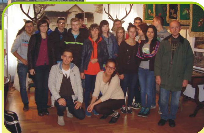
Uczniowie klasy IIb LO grupa sportowo-obronna w Muzeum Szlachty Mazowieckiej w Ciechanowie /październik 2013/.