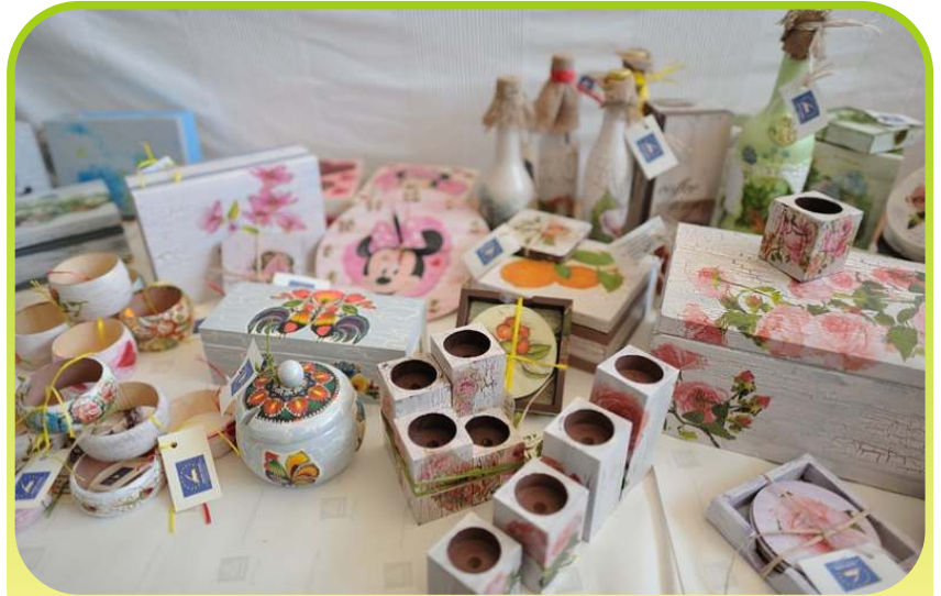
Prace wykonane techniką decoupage przez uczniów ZS.