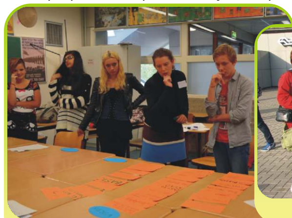
Burza mózgów podczas zajęć.

Kolejny wyjazd w lutym 2014 - spotkamy się w mieście Hannover - Niemcy.