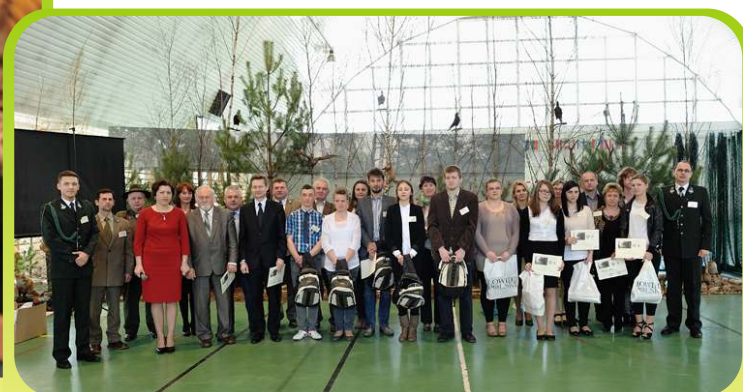
Finaliści IV Edycji Mazowieckiego Konkursu EKO-ŁOW /kwiecień 2013/

Zaczynaliśmy skromnie, od konkursu szkolnego. A w tym roku czeka nas już V Mazowiecka Edycja.