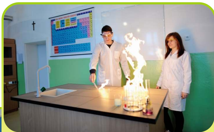
Uczniowie w pracowni podczas rozszerzonych zajęć z chemii.