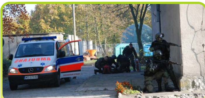
Pozorowane naruszenie systemu ochrony – pokazy w JW w Przasnyszu /październik 2012/.