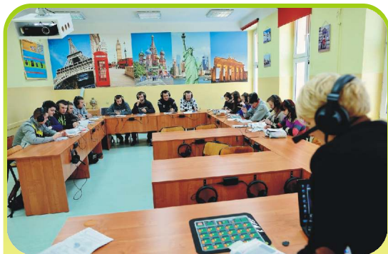
Maturzyści na lekcji języka rosyjskiego.