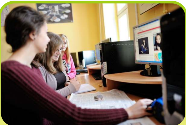
Przygotowujemy nasz pierwszy reportaż

Warsztaty dziennikarskie: Zdobywamy tu wiedzę i umiejętności niezbędne w pracy reporterskiej i publicystycznej. Uczniowie mają możliwość praktycznego sprawdzenia się w zawodzie, piszą felietony, reportaże, robią wywiady, przygotowują i sortują zdobyty materiał podczas kolegiów redakcyjnych. Swoje teksty i zdjęcia mieli już okazję publikować w tygodniku płońskim.