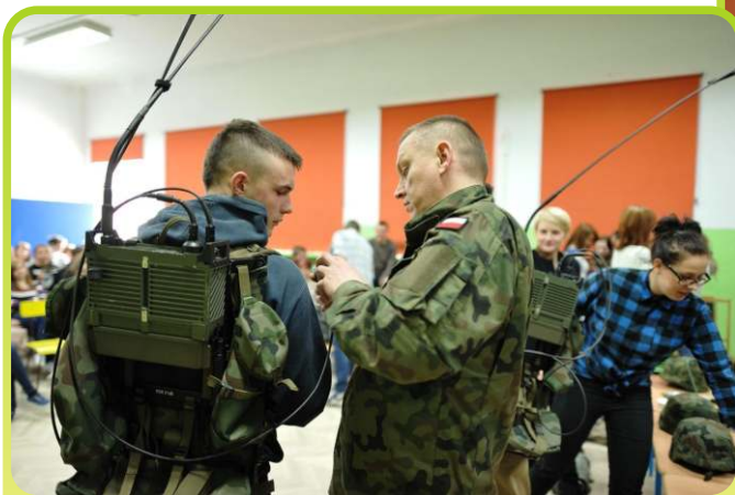
Spotkanie z żołnierzami 2 Przasnyskiego Ośrodka Radioelektronicznego w naszej szkole /luty 2014/.