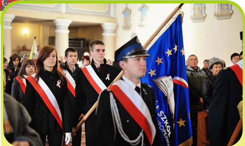
Poczet sztandarowy Zespołu Szkół na uroczystej Mszy Św.

Co roku, 11 listopada bierzemy udział w Gminno-Parafialnych obchodach Narodowego Święta Niepodległości. W uroczystościach 11 listopada 2013r. z okazji 95 rocznicy odzyskania suwerenności, uczestniczył poczet sztandarowy Zespołu Szkół im. Integracji Europejskiej i reprezentacja 426 Wielopoziomowej Drużyny Harcerskiej „Wagabundy”.