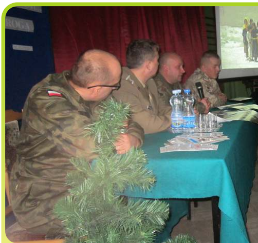
Prezentacja z Afganistanu i Iraku /styczeń 2013/.