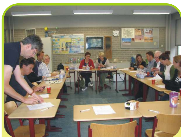
Spotkanie nauczycieli szkół partnerskich w Mendelcollage.

W dniach 18-22 wrześni 2 2013r odbył się wyjazd przedstawicieli naszej grupy projektowej do Holandii. Wyjazd rozpoczął realizację projektu Comenius-Partnerskie Projekty Szkół. Celem wizyty w Mendelcollage było wspólne, szczegółowe zaplanowanie kluczowych działań na pierwszy semestr roku szkolnego 2013/2014 oraz ogólny zarys współpracy w roku szkolnym 2014/2015.