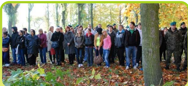
Grupa sportowo-obronna klasy IB LO z wizytą w JW w Przasnyszu /październik 2012/.

W roku szkolnym 2012/2013 nasze liceum, klasa sportowo-obronna, nawiązało współpracę z Jednostką Wojskową – 2 Ośrodka Radiotelegraficznego - w Przasnyszu. W październiku odwiedziliśmy jednostkę. Młodzież mogła obejrzeć ćwiczenia , w których udział wzięły wewnętrzne siły ochronne oraz żołnierze Żandarmerii Wojskowej, Policja, Państwowa Straż Pożarna a także Pogotowie Ratunkowe - „Szkolenie z pozorowanym naruszeniem systemu ochrony.”. W styczniu 2013r. przyjechali do nas żołnierze z 2 Przasnyskiego Ośrodka Radioelektronicznego. Przedstawili materiały, jakie powstały w trakcie misji stabilizacyjnych w Afganistanie i Iraku, w których brały udział Polskie Siły Zbrojne. Oglądaliśmy piękne zdjęcia przedstawiające ludność i krajobraz Afganistanu a także film nakręcony z bojowego śmigłowca. Panowie opowiadali również o własnych doświadczeniach i wspomnieniach z uczestnictwa w zagranicznych misjach, mówili o tęsknocie za domem i bliskimi, o sposobach radzenia sobie ze stresem, o różnicach i barierach kulturowych. Żołnierze przywieźli foldery swojej Jednostki Wojskowej oraz plakaty MON-u promujące służbę w Wojsku Polskim. 25 kwietnia grupa sportowo-obronna ponownie odwiedziła zaprzyjaźnioną Jednostkę Wojskową w Przasnyszu. Tym razem uczestniczyliśmy w obchodach 10 rocznicy utworzenia 2. Przasnyskiego Ośrodka Radioelektronicznego.