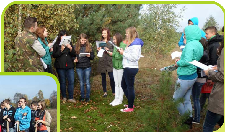
Uczniowie klasy I LO na zajęciach terenowych /wrzesień 2013/.

Wszystkie akcje budzą ogromny entuzjazm wśród młodzieży i integrują ze sobą całą społeczność szkolną. Starsi uczniowie pomagają w wielu działaniach młodszym a swoją proekologiczną postawą dają im dobry przykład.