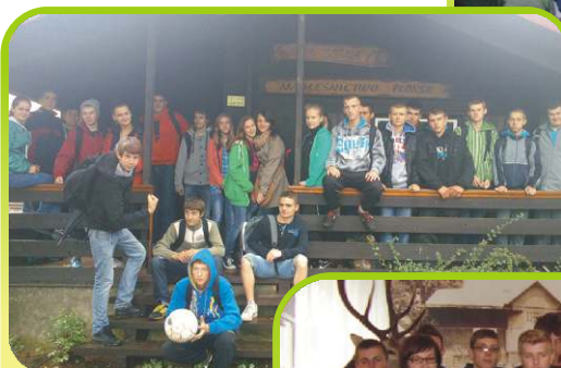
Młodzież z klasy I LO i I ZSW w szkółce leśnej w Kucharach Królewskich /wrzesień 2013/.