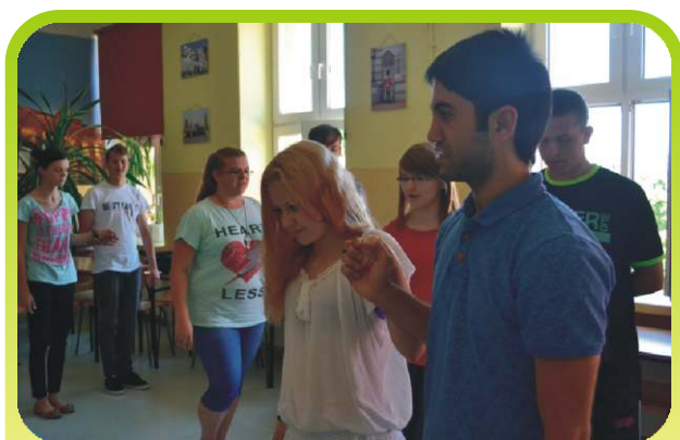
Nauka tańca ludowego.