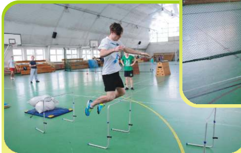
Test sprawnościowy - Policja.

Doskonalimy cechy motoryczne takie jak: siła, szybkość, zwinność, skoczność, koordynacja. →