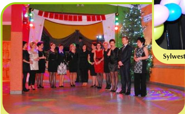
Sylwester 2013/14. Życzenia noworoczne.