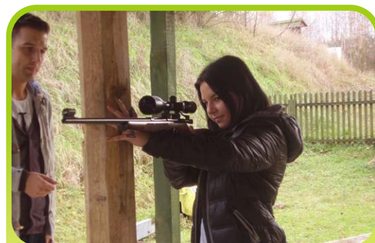
Uczennica klasy IIb LO grupy sportowo-obronnej na strzelnicy w Chotumiu /październik 2013/.