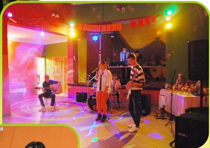
Zabawa Andrzejkowa, występ szkolnego zespołu "Rebells' Time".

Rady Rodziców Zespołu Szkół wspólnie z Dyrekcją zorganizowały wspaniałe bale: andrzejkowy i sylwestrowy. Dochód z powyższych akcji został przeznaczony dla uczniów Zespołu Szkół. Dziękujemy!